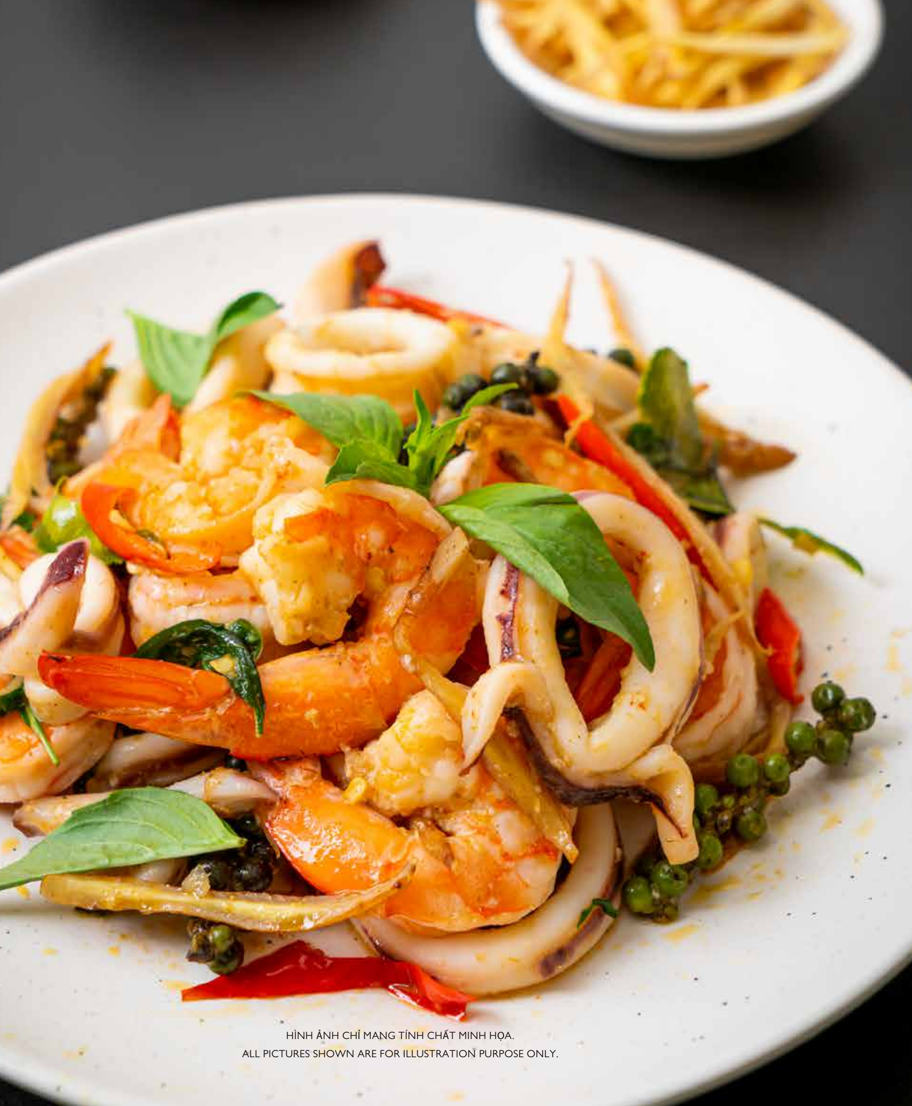
HÌNH ẢNH CHỈ MANG TÍNH CHẤT MINH HỌA. ALL PICTURES SHOWN ARE FOR ILLUSTRATION PURPOSE ONLY.